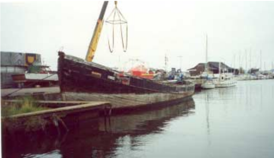
Foto af Ellan før afskibningen fra Råå havn. Hele overbygningen, master osv. er fjernet for at Ellan kunne sænkes uden skade for miljøet. Den hvide navneplade i stævnen foran hullet i rælingen fandt vi ikke under dykket, men den er identisk med den vi fandt i agterenden.

Jeg kontaktede Bengt Holm for af den vej at skaffe nogle foto af Ellan og han var behjælpelig med foto af Ellan fra tiden i aktiv tjeneste og umiddelbart før afskibningen fra Råå havn.