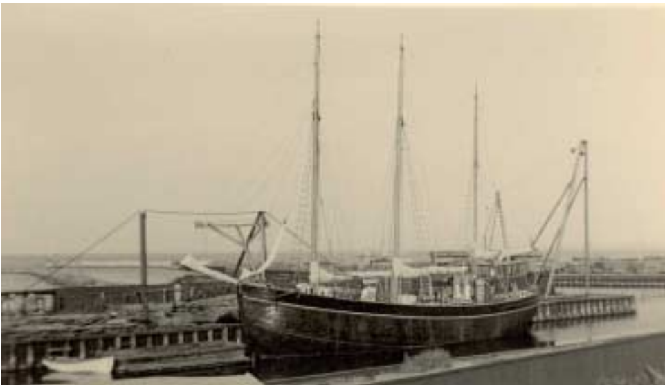
Foto af ELLAN fra tiden i aktiv tjeneste.

Foto af Ellan før afskibningen fra Råå havn. Hele overbygningen, master osv. er fjernet for at Ellan kunne sænkes uden skade for miljøet. Den hvide navneplade i stævnen foran hullet i rælingen fandt vi ikke under dykket, men den er identisk med den vi fandt i agterenden.